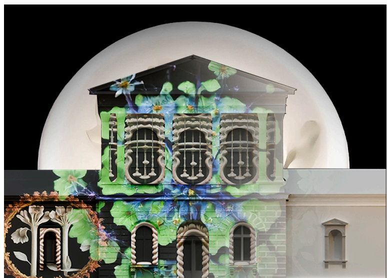
21.00–23.00 Bloom | Videomapping / Magia naturii și a științei

11.00–02.00 Expoziție de costume populare tradiționale